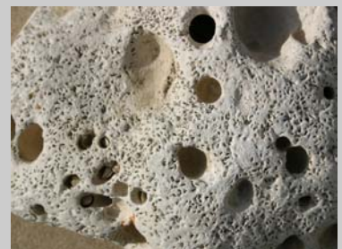
Kalksten med huller fra boremuslingen